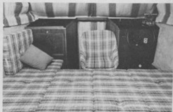
Her er bordet sænket og førerstolen drejet ud, hvorved der er blevet en dejlig bred dobbeltsøfa.